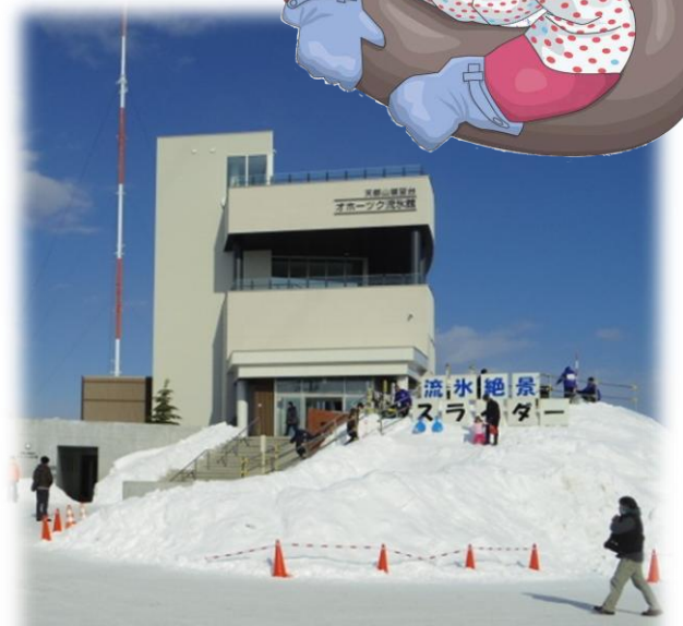
2015年8月オープンした天都山展望台・オホーツク流氷館の敷地内に出現!!

流水に埋め尽くされたオホーツク海を眺めながら、雪国ならではの、全長100mのチューブボブスレーコースや、氷の滑り台を体験できます。大人も子供も楽しめるアトラクションです。週末には、色んな楽しいイベントを開催します。